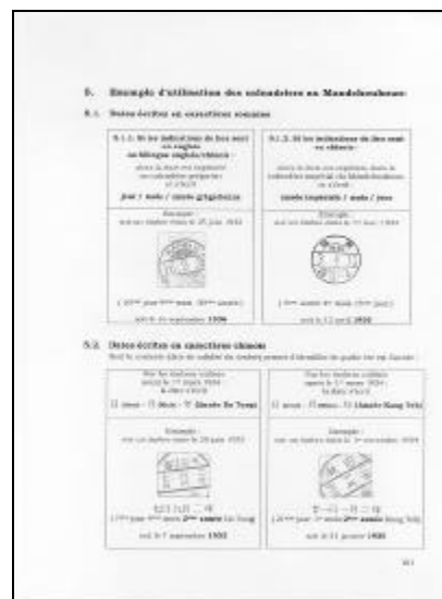
Partie III : Fiches de lecture : les cachets à date Fiches de lecture des différents calendriers en usage sur les cachets à date chinois de l'Empire, de la République, des occupations japonaises et du Mandchoukouo.

Prix : 20 € + 3€ de port . Adresser un chèque à :