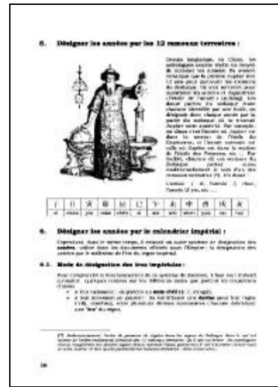
Partie I : didactique Présentation des différents calendriers en usage en Chine à la fin de l'Empire et sous la République : calendriers Nian, Sui, millésimes zodiacaux, impériaux, GanZhi (lunaires), républicains, japonais (Nengo) et du Mandchoukouo